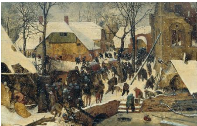
De aanbidding der koningen in de sneeuw. Collection Oskar Reinhart 'Am Römerholz', Winterthur

Het moet voor de beschouwer in de zestiende eeuw een gevoel van verwondering hebben opgeroepen. Het is kenmerkend voor Pieter Bruegel's schilderijen, de symbolische en/of moralistische strekking is verweven in de encenering. Voor ons is het een uitdaging om die boodschap te achterhalen.